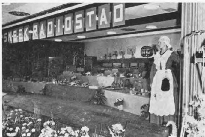
De druk op de traditionele knop was het sein voor twee in Friese klederdracht geklede meisjes om de afsluiting tot het toneel te openen, waardoor een imposante show van onze producten zichtbaar werd.