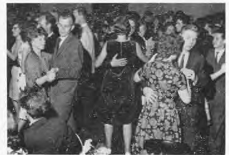
Quick, quick, slow.