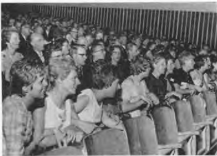
Schön ist die Jugendzeit...