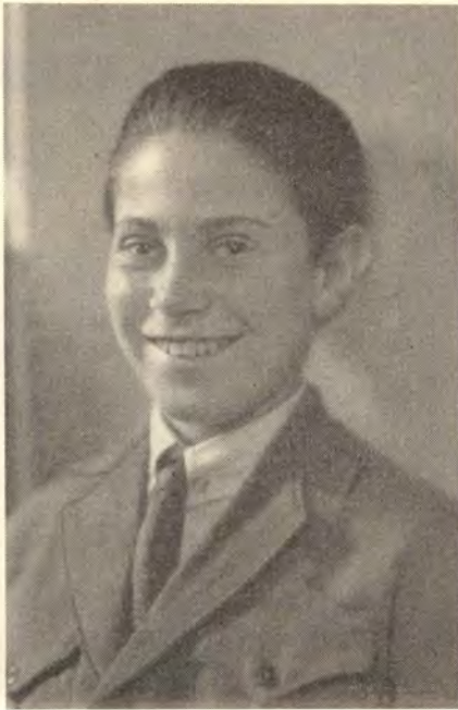
Buitengewoon mooie cijfers op het Lyceum...