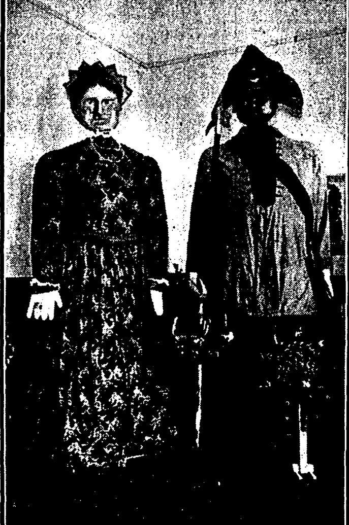
De reus Valuas en zijn huisvrouw, de stichters van de stad Venlo, die men thans in het gebouw van de Volksuniversiteit te Rotterdam kan gaan zien.