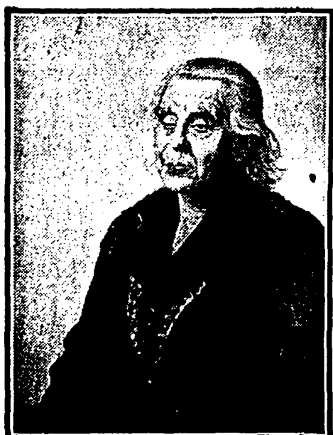
Kunst in de residentie. In Kunstzaal Nieuwenhuisen Segar wordt een aantal werken van Dirk Nijland tentoongesteld.