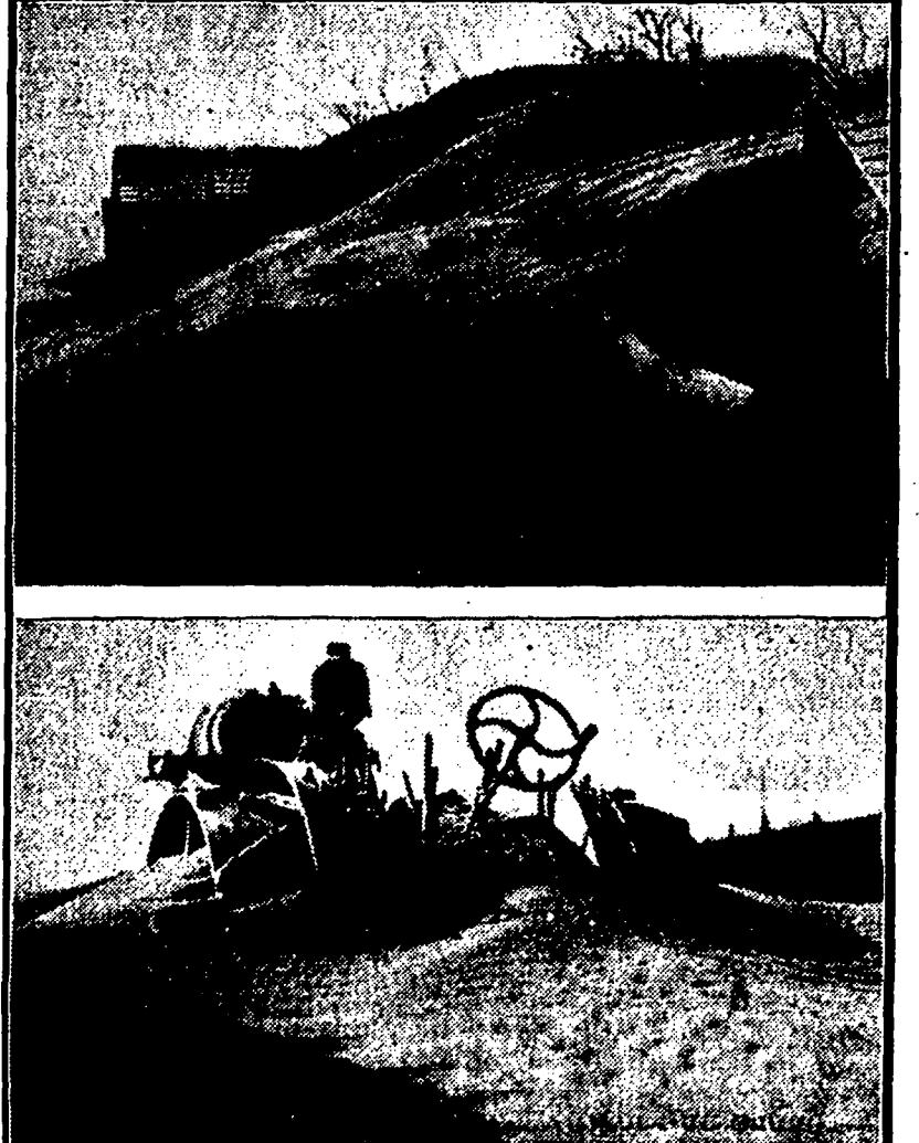
Geweldige zandstormen hebben de laatste weken gewoed in een deel van de Ver. Staten. Een resultaat daarvan in het noordoosten van Zuid-Dakota.