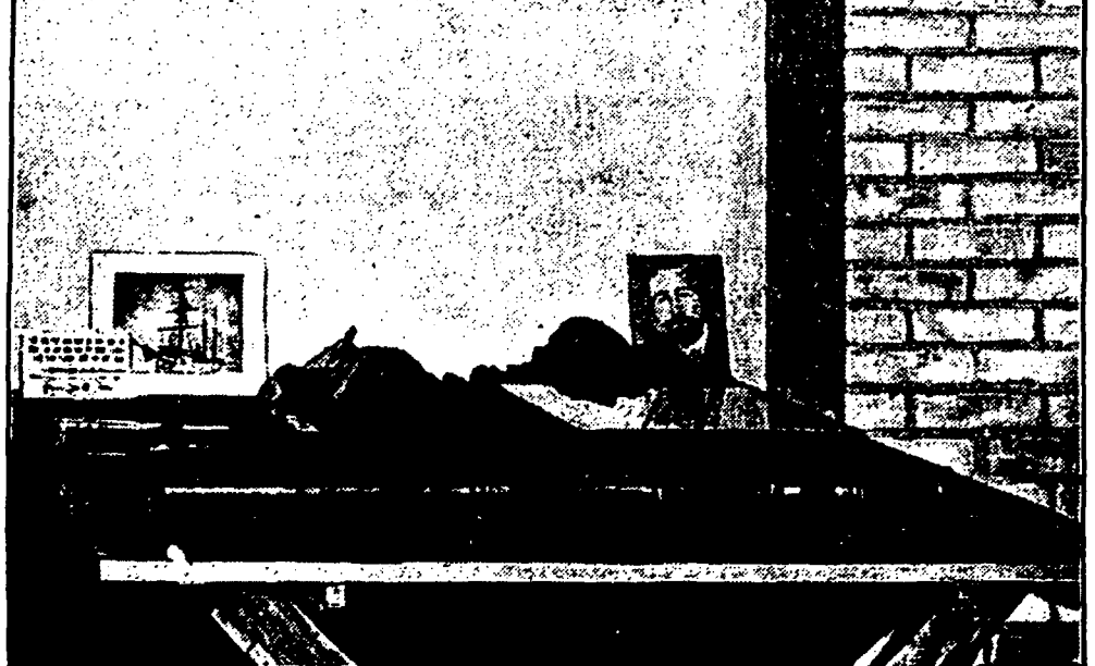
In het benedendaalfe worden zijn grafische werken geexposeerd. Links dan een vrouwportret, terwijl rechts een stilleven met Joseph Conrad staat afgebeeld.