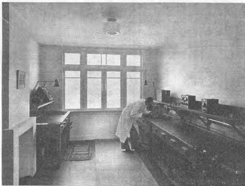
Fig. 2. Praktijklokaal.

Zoals de hierbij afgedrukte foto's laten zien, is ook de inrichting der leslokalen