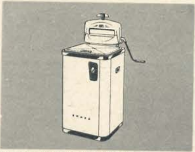
ERRES, PLUBO WASHMACHINE

In de vorm ligt zijn kracht. Dóór zijn unieke vorm een 2½ x grotere stofverzamelruimte en een enorm zuigvermogen f. 142.50