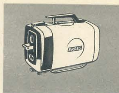
ERRES, JUMBO STOFZUIGER

Uiterste verfijning van vormgeving en techniek. Een voorname, elegante haute couture lijn f. 288.-