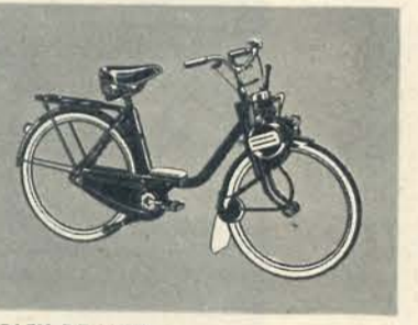
SOLEX DE LUXE

RS fietsen, fantastische fietsen. Keuze uit ruim 20 modellen in prachtige kleuren-combinaties. Prijzen vanaf f. 149.50