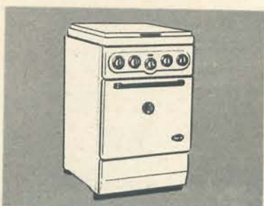
INVENTA „FAIR LADY” GASFORNUIS

Een waar sieraad in Uw keuken. De bijzondere constructie van de ERRES wasbeweger zorgt dat het wasgoed onder en boven gewassen wordt f. 340.-