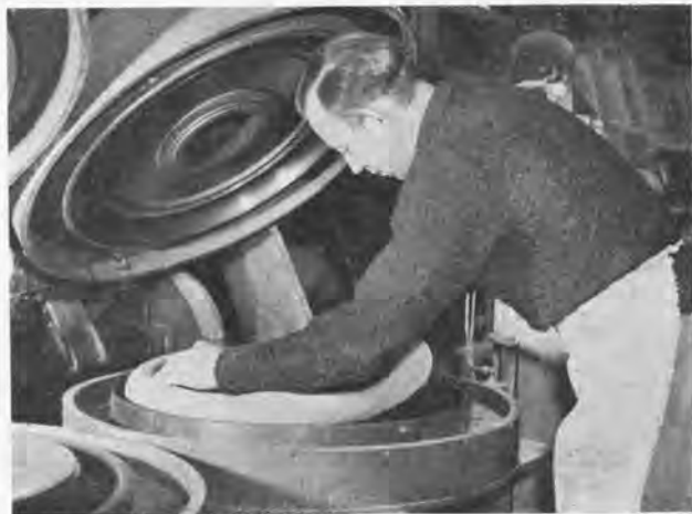
Geopende vulcaniseermatrijs voor buitenbanden