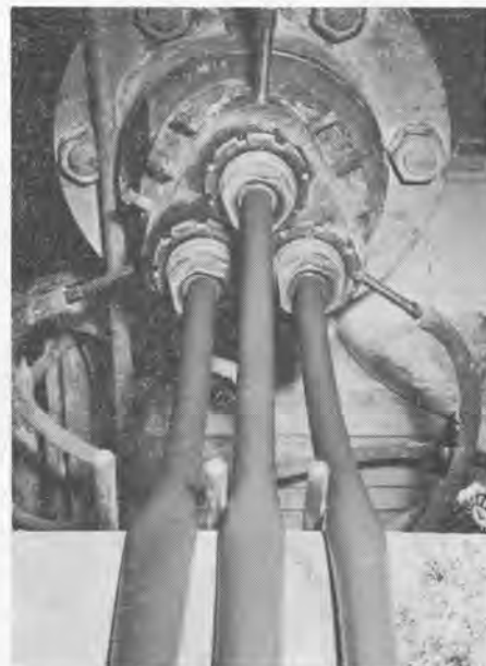
Spuitskop van de machine ter vervaardiging van het buismateriaal voor de Solex-potdichtbinnenband.

Het vulcaniseren van de potdicht Solexbanden vindt dus plaats in ronde matrijzen nadat de band geheel gereed is.