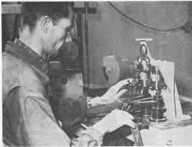
Machine voor het vervaardigen (door stijf tegen elkaar aandrukken van de uiteinden van het nog onge vulcaniseerde materiaal) van de las van de Solex-binnenband.