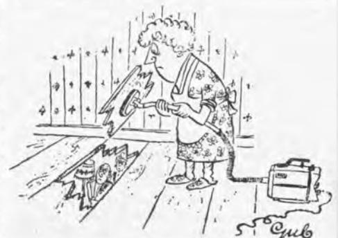
(Uit Pret in Prent, uitgave van R.S. Stokvis & Zonen N.V.).