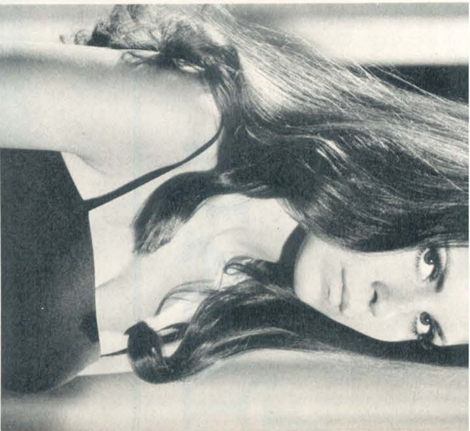
Jongste dochter Tina zei tegen haar vader: „U zingt vrij behoorlijk.”

Andere ontmoetingen hebben onplezierig gevolgen gehad. De schuld lag duidelijk bij hem. Toen Sinatra en enige van zijn vrienden een van de zalen van het Beverly Hills-hotel binnen-