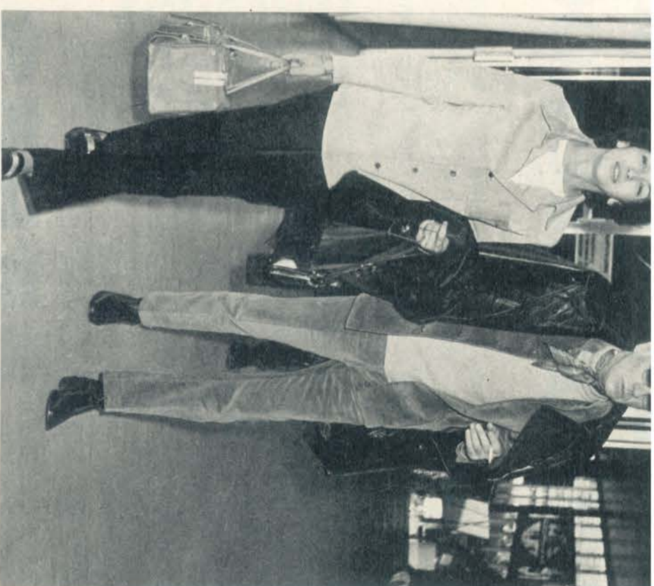
Peter Lawford, eens behorend tot de Sinatra-clan, is uit de gratie.