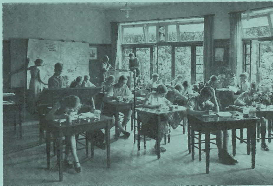
Een klaslokaal van de Pallas Atheneschool te Amersfoort waar men opmerkelijke resultaten behaalde met het nieuwe systeem

De cultuurvorming gaat uit van die kleine groep van begaafden, eventueel nog vermeerderd met de besten uit de groep der vluggen. In het nieuwe onderwijs-systeem, of liever opvoedingssysteem legt men het erop aan, dat de kinderen reeds op school beginnen met hun menselijke deugden tot ontwikkeling en in toepassing te brengen. Met andere woorden, zij mogen elkaar helpen. Dit laatste is een reactie op het bekende: Foei Jantje, je mag Pietje niet voorzeggen.