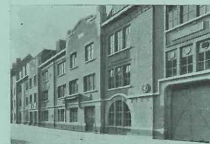
Wat wij destijds een reuzenfabriek vonden — de Stortenbekerstraat