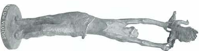
Monument, aangeboden door ons personeel en staande op het voorterrein van onze fabriek te den Haag. Het deities luidt: „HOGER ZIJ UW 'VLUCHT!'”.