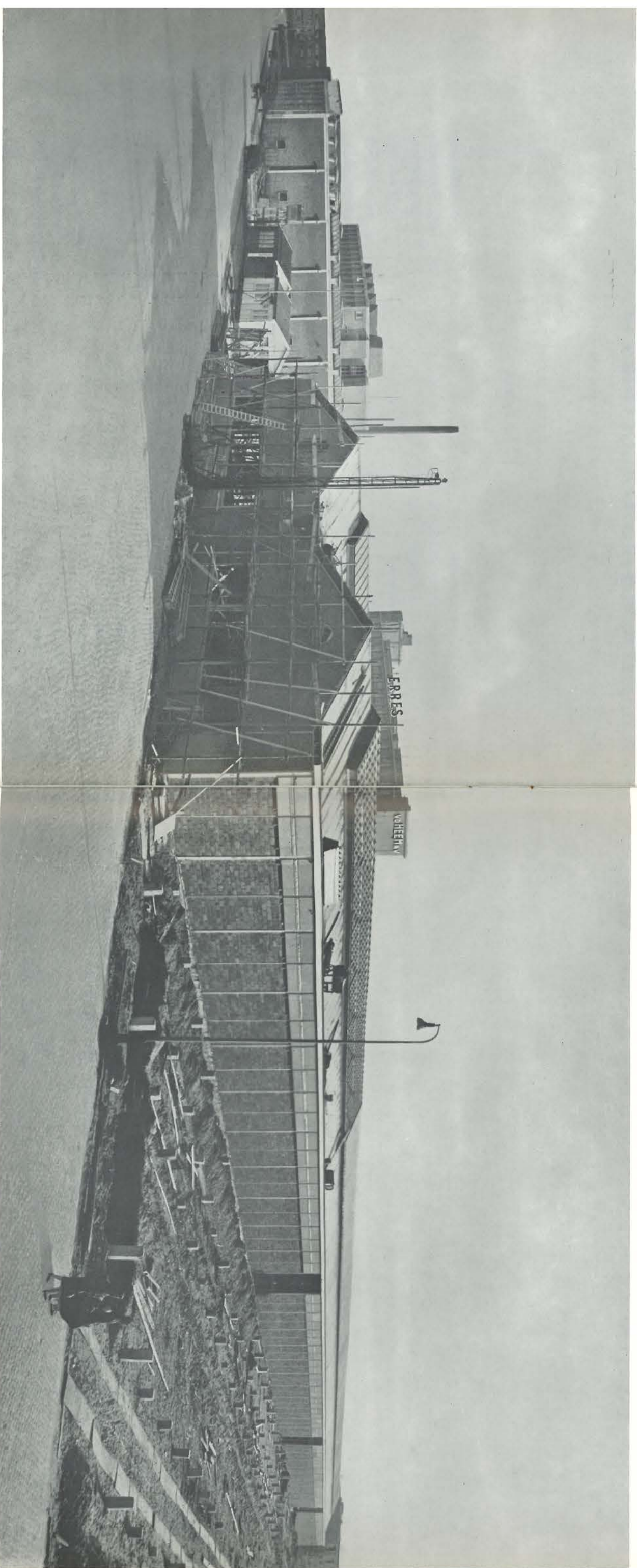
De in aanbouw zijnde fabriek voor radio- en televisiekasten op ons