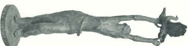
Monument, aangeboden door ons personeel en staande op het voorterrein van onze fabriek te den Haag. Het deuvies luidt: „HOGER ZIJ UW VLUCHT!”.