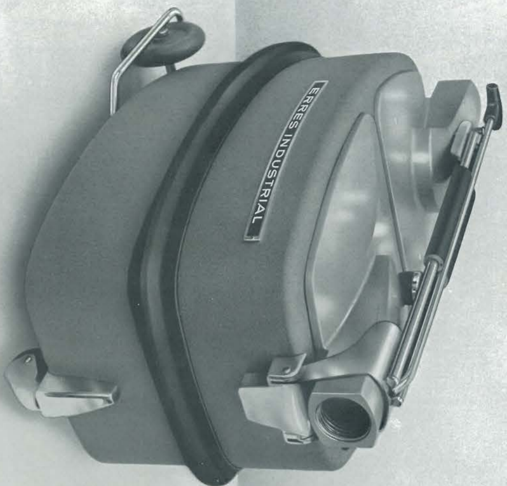
Industrie Stofzuiger I.S. 150.

De verhoging van onze omzet werd voornamelijk bereikt door een sterke stijging van de export. Vooral de uitvoer van radio toestellen ontwikkelde zich zeer gunstig en in