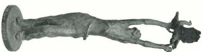
Monument, aangeboden door ons personeel en staande op het voorterrein van onze fabriek te den Haag. Het deities beeld: „HOGER ZIJ UW VLUCHT“.