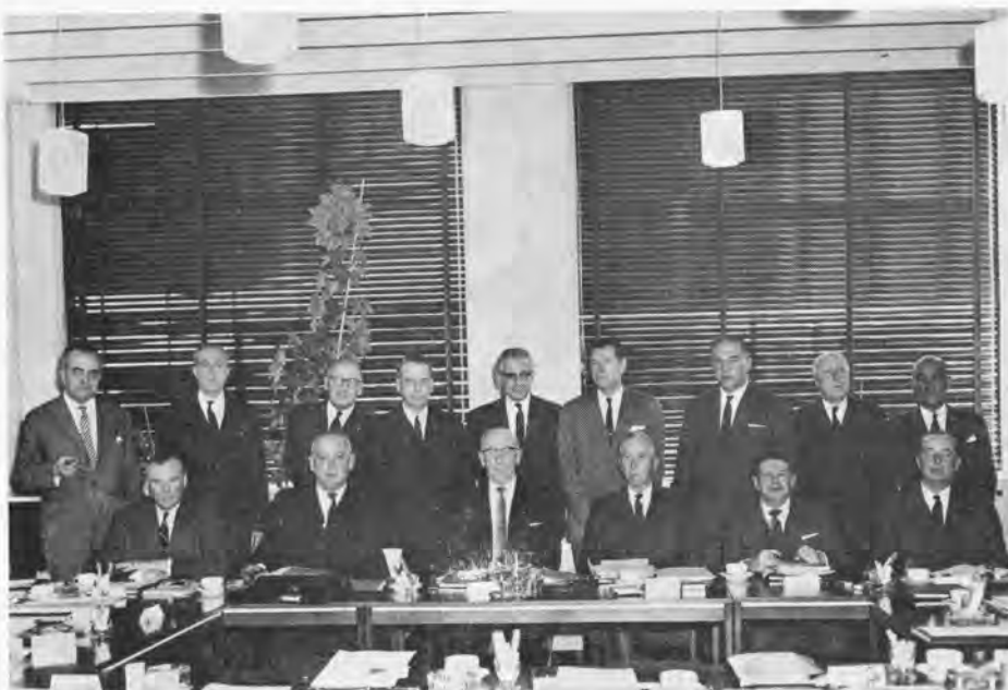
Tijdens de vergadering van de Raad van Commissarissen en de Raad van Bestuur van Indoheem N.V. waren wij in de gelegenheid van dit voor het eerst in deze samenstelling bijeen zijnde gezelschap een foto te maken.

De N.V. Gebr. Van Niftrik is een sterk groeiend bedrijf in de kunststoffensector; het zal onder de huidige directie als een zelfstandige eenheid van het Indoheem concern blijven werken.