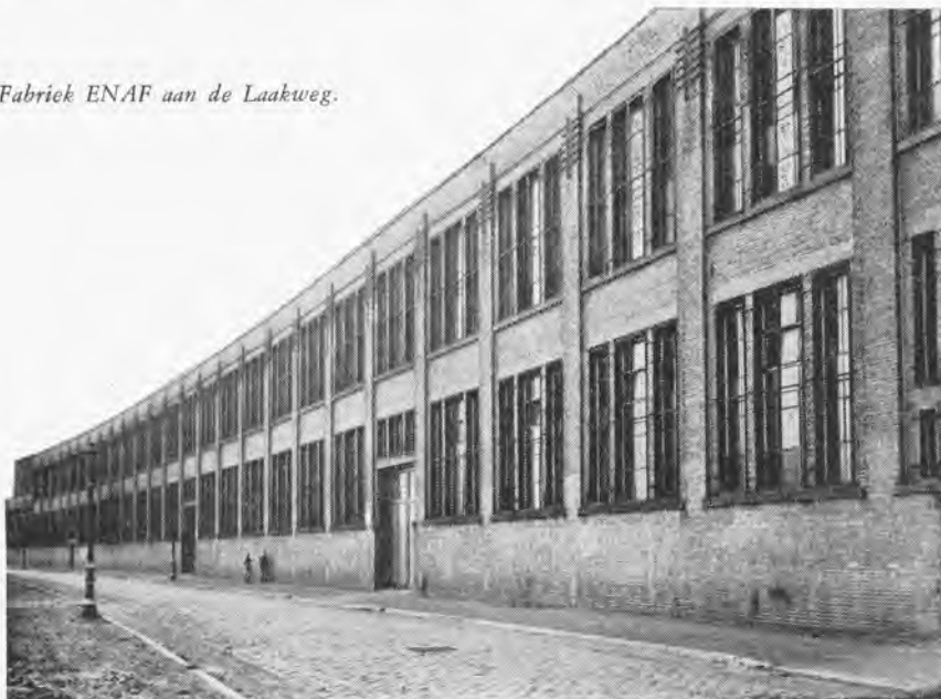
Fabriek ENAF aan de Laakweg.