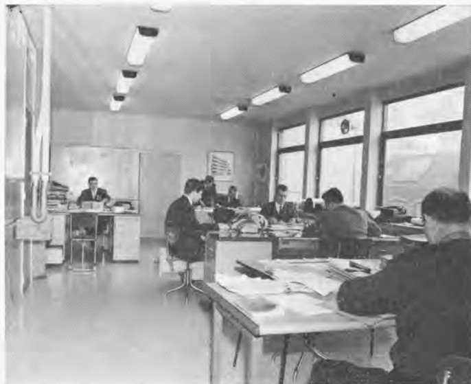
Een van de kantoren