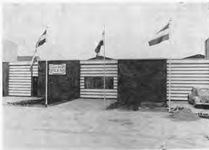
Vooraanzicht pand Zeelandlaan.

zodat men geen opslagruimte nodig heeft en beschadiging voorkomen wordt.