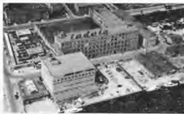
INDOLA - Rijswijk

ligt het accent veel meer op het direct contact tussen fabrikant en afnemer. Vele soorten van kapsalons en andere interieurs zijn hier opgebouwd. De inventaris bestaande uit: haardrogers, stoomkappen, het nieuwe permanenttoestel AER-O-PERM (een opzienbarende vinding van Indola, een nieuw systeem van permanenten), sterilisator en massagebanken, spoelbakken en andere apparatuur in zachte pasteltinten, vormt een kleurenmengeling die overeenkomt met de even zovele haarkleuren, die er met de vele cosmetica en verfjes van deze firma gecreëerd kunnen worden. Tevens vinden wij er de verschillende farmaceutische produkten van de farmaceutisch-chemische fabrieken EMB en CIC uitgesteld. De overige produkten en technische apparatuur, die door Indola worden gefabriceerd, vinden wij niet in deze 900 vierkante meter grote showroom, maar moeten wij in de showroom van Interheem in Scheveningen zoeken.