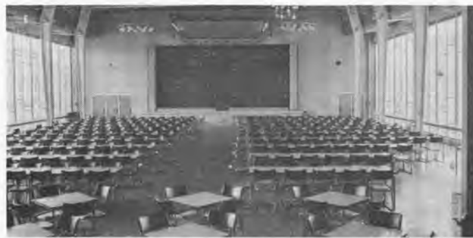
Bovenstaande foto's willen u van boven naar beneden een indruk geven van: de afdeling Gereedschapmakerij met op het balkon de Bedrijfs-school; de ontvangthal van het hoofdgebouw op de vierde etage; de kantoorruimte waarin onder andere de Technisch Commerciële afdeling is gehuisvest; de grote kantine annex Ontspanningsgebouw.