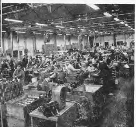
Montage- en Wickelafdeling.