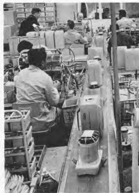
De Jumbo-stofzuigerband aan de Keulsekade.

Op de bovenverdieping maken wij kennis met de elektrische boormachines, de beroemde Heem-master en de hobby-sets, die naar mijn mening tot de mooiste (qua vormgeving) en beste (qua werking) Van der