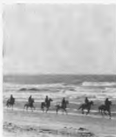
"In gestrekte draf naar ongekende verten"

Wij zijn ervan overtuigd dat er onder onze ruim 5.500 medewerkers zeker honderd nieuwsjagers en stukjesschrijvers schuilen. Wij zijn zo optimistisch te geloven dat wij binnenkort uit alle bedrijfsdelen van het Indoheem concern het nieuws krijgen toegezonden. Gebeurt dit, dan kunnen wij spoedig het uiterlijk en de omvang van ons nieuwe maandblad aanpassen aan de grote hoeveelheid tekst.