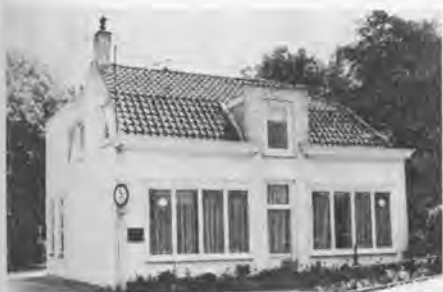
Het kantoor van de EMB.

De ligging van deze fabriek kunnen wij zonder meer uniek noemen.