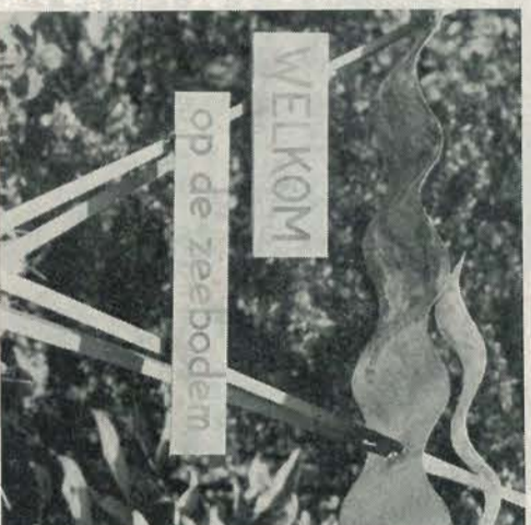
Bij de ingang van de Noordoostpolder