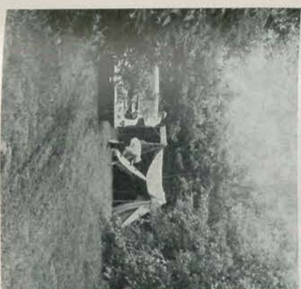
Kampeertrein „De Voorst“