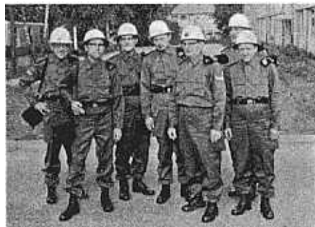
Onze BZB-ploeg die, bij de landelijke finale in Philips verband, een eervolle tweede plaats wist te veroveren.