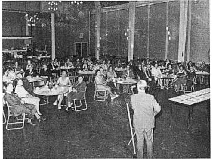
De heer G. Kruijs tijdens zijn toespraak

appèl op het personeel werd gedaan. De bestaande groepen moesten worden uitgebreid tot een hechte BZB-organisatie. Dat appèl was indertijd niet tevergeefs.