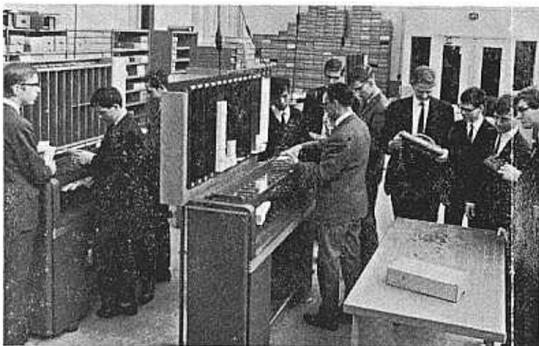
Aandacht voor de heer F. van Leeuwarden op de afdeling Ponskaartenadministratie.

Dit onderwerp, waarover Ir. Arink op 30 maart j.l. een praatje hield voor een 10-tal middelbare scholieren, vormde het sluitstuk van een 3-daagse vakantiestage.