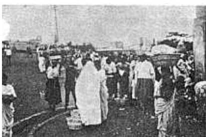
Op de markt voor Indiërs en Bantoes in Durban.