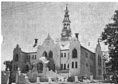
De kerk van Swellendam.

Zo nu en dan worden wij door de krant of de TV voorgelicht over het rassenprobleem in Zuid-Afrika. Het is mode en behoort tot de goede toon het beleid van de blanken te veroordelen. Soms zelfs in dermate scherpe zwart-wit schilderingen dat er twijfel rijst of het allemaal wel zo erg is. Dat was ook mijn ervaring toen ik hier