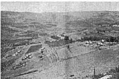
De groene heuvels van de Transkei.

Niet ver van Johannesburg ligt het veel rustiger PRETORIA. Dit is een echt Afrikaanse stad. Vroeger, op de lagere school, heb ik de boeken van Penning gelezen over de kafferoorlogen en de boerenoorlog. De herinneringen daaraan vond ik in Pretoria. Het Voortrekkermonument en de standbeelden memoreren de feiten. De namen vond ik op het kerkhof. Daar zag ik onder andere de graven van Paul Kruger, Pretorius, Strijdom en Verwoerd. DURBAN is de meest Engelse stad van de republiek. Hier wonen veel Indiërs. De vrouwen gaan gekleed zoals dat gebruikelijk is in die streek van India waar zij of hun ouders vandaan komen.