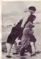
Samen tegenwind trotsaand.

Het zal u na het lezen van de overdenking van onze directie in het vorige nummer wellicht niet zo vergaan zijn als ons, namelijk: eerst een borrel voor de schrik, daarna nog een op de goede afloop en tenslotte toch maar rustig aan de oerbollen. Sprekend namens u, lezers-collega's, menen wij ook uw gevoelens weer te geven bij onze uitdrukking van solidariteit met de door de directie uitgesproken gedachten. Vergelijken wij de huidige omschakeling in het bedrijf met de omschakeling op aardgas, dan zal de vlam van onze gezamenlijke inspanning straks ook tweemaal zoveel warmte geven als voorheen.