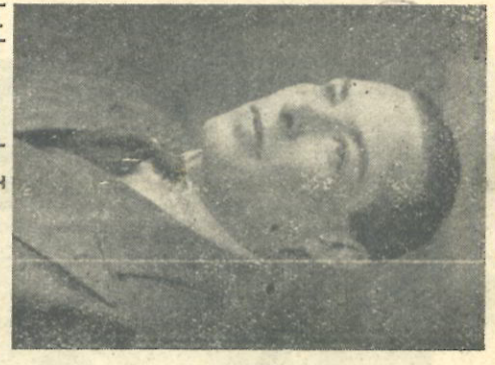
De leider van de Tour.