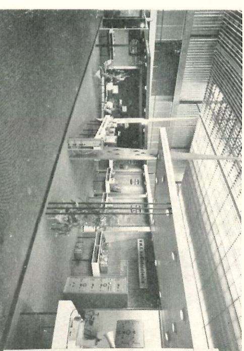
De onder Van der Heem-naam te verkopen producten zijn voor het eerst in een aparte Van der Heem-stand tentoongesteld.