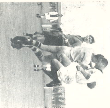
De doelman van het TV-montage elftal weet door resoluut ingrijpen ergert te voorkomen.

En ten slotte poule D. Daarin waren ondergebracht de Stamperij, ENAF en de Montageschool. Door overwinningen resp. van 1—0 en 3—0 op ENAF en Montageschool wist hier de Stamperij tot de halve finale door te dringen. In tegenstelling tot andere jaren sprak nu de ENAF ook een woordje mee. Het team wist met 4—1 van de