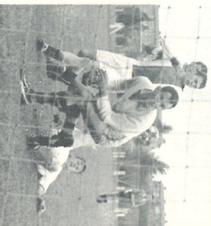
De op de grond liggende Utrechtster is het er kennelijk niet mee eens, dat de Haagse doelman weer een avond heeft weten af te slaan. Maar spannend was het!

Montageschool te winnen, wat voor de ENAF de tweede plaats in de poule betekende.