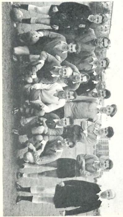
Het Haagse TV-Montage-team kon tijdens de wedstrijd tegen Utrecht niet tot haar normale spel komen.