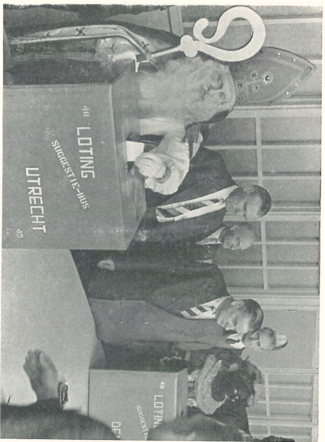
Directie en bedrijfsleiding hebben zich om de suggestiebussen geschaard, waaruit Sinterklaas de loten van de prijswinnaars haalt.