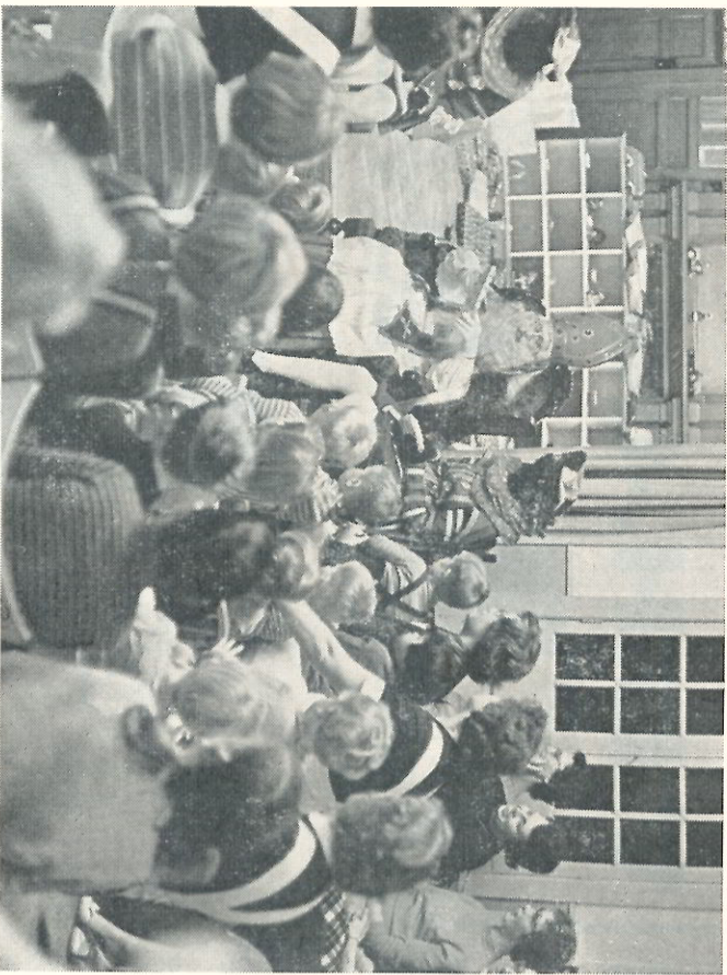
Eerst Sint-Nicolaas een cadeautje en dan... de kinderen zelf.