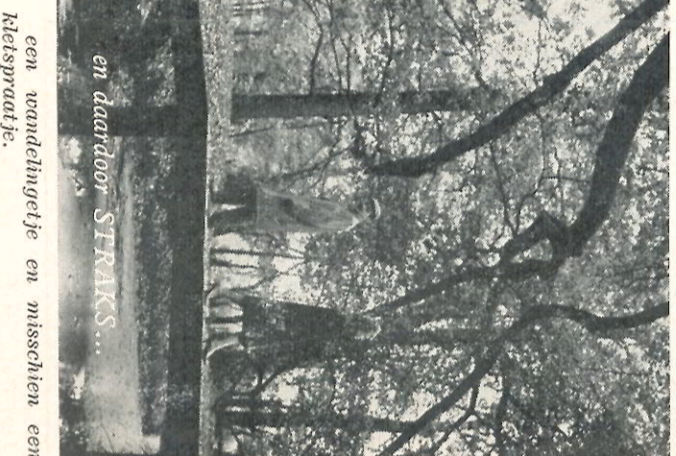
en daardoor straks...

een wandelingetje en misschien een kletspraaltje.