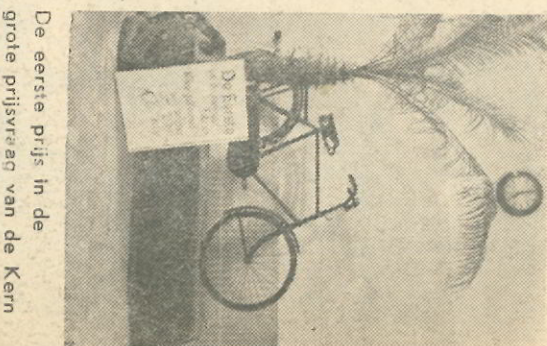
De eerste prijs in de grote prijsvraag van de Kern