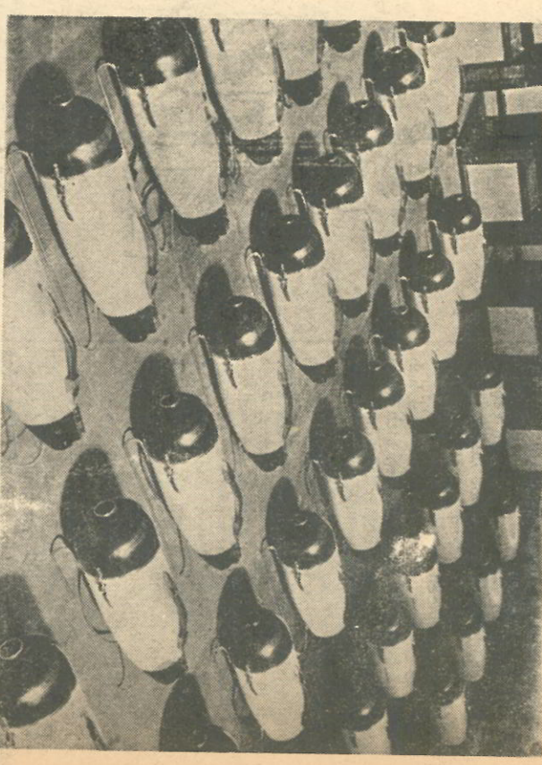
De torpedovormige SZ 14 is onze Specialité de la Maison