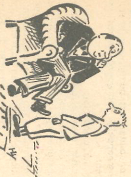
Ja... en as ik asch nou niet met as as had gespeld...

Zolang een nieuwe spelling begon met het overboord zetten van enige verouderde regels, werd hij met een hoeraatje begroet, althans door de scholieren, die later tot hun smert ervoeren, dat de oudere generatie niets van een nieuwe spelling wilde weten (en ook nu niet wil weten). Kwam men solliciteren (en voor de oorlog was het een toer om een baan te vinden) dan barstten die oudjes in luid gelach uit en informeerden sarcastisch hoe men dan het verschildt te