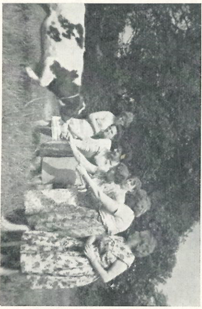
Koefje ... boel