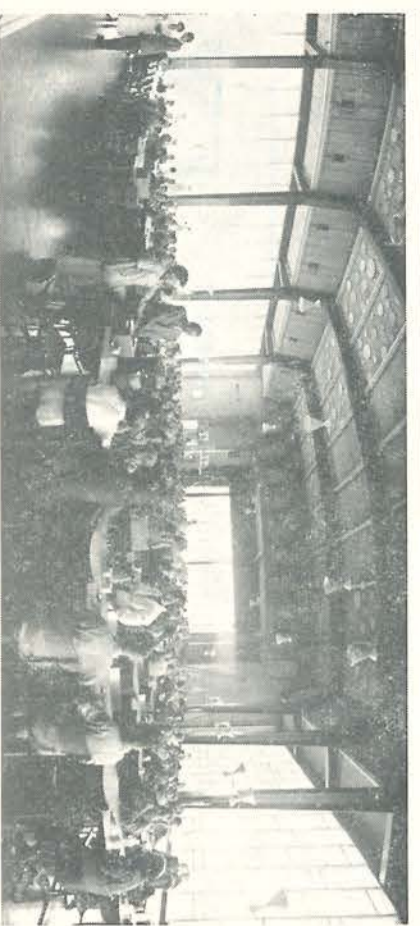
Onze kantine, zoals een fotograaf haar nog nooit gezien heeft, namelijk een opname welke werd vervaardigd met een Panox 140° supergroothoekcamera.