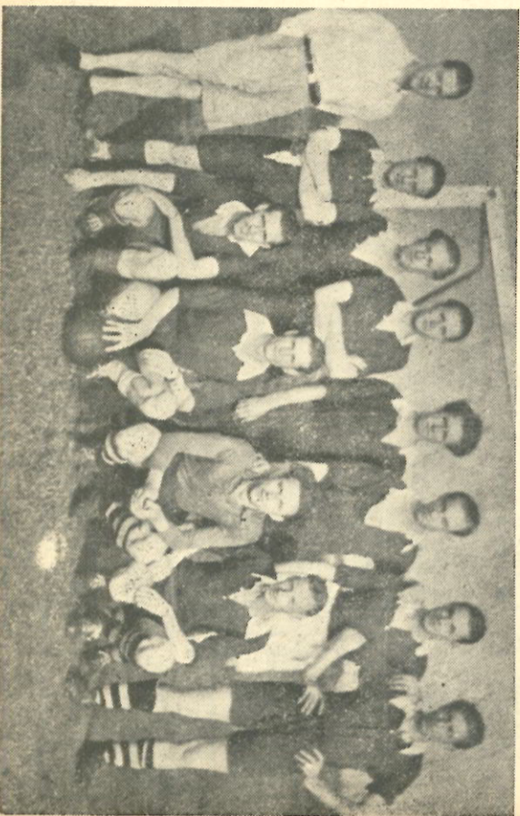
De Gereedschapmakerij V.D.H. Voetbalkampioen