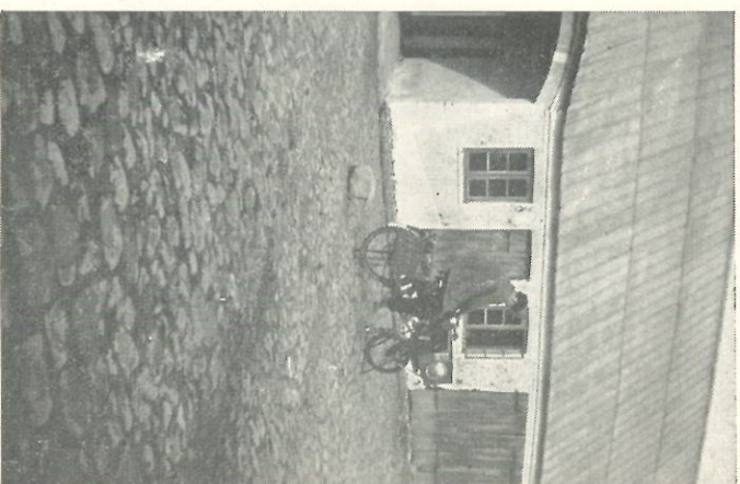
De scharenslepp op zijn merkwaardig verveermiddel.

Hier bezochten wij één der vele witte kerkerjes, welke Denemarken bezit. De Dominee vertelde ons vol trots, dat het kerke 800 jaar en de beuk ervóór 400 jaar oud waren, de oudste van het land.