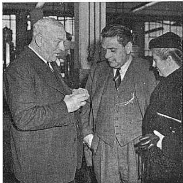
„Twee officieren werden ondernemer”