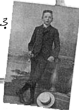
„In 't verleden ligt het heden”