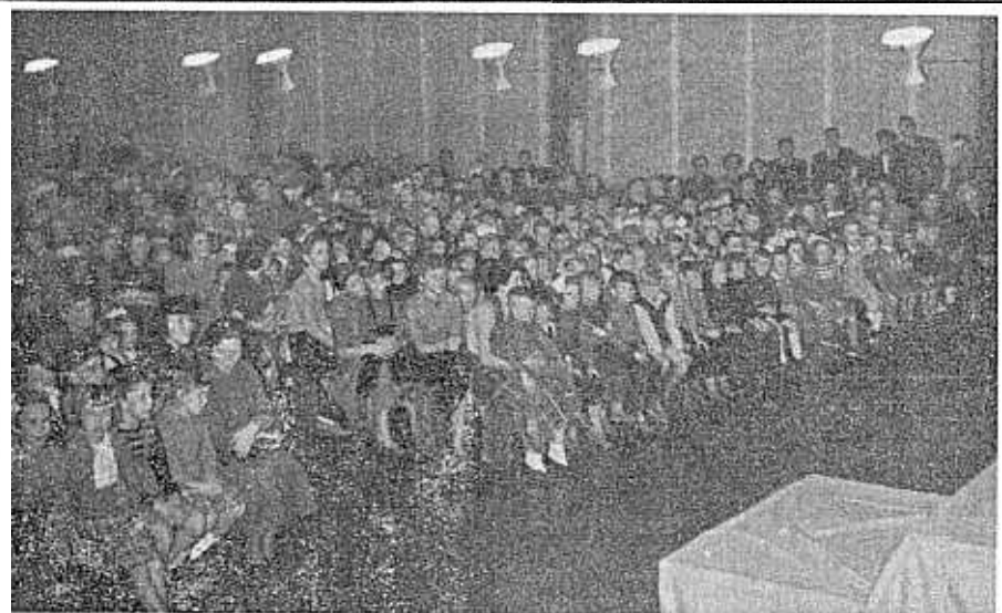
HAAGSE VDH JEUGD IN GESPANNEN AANDACHT