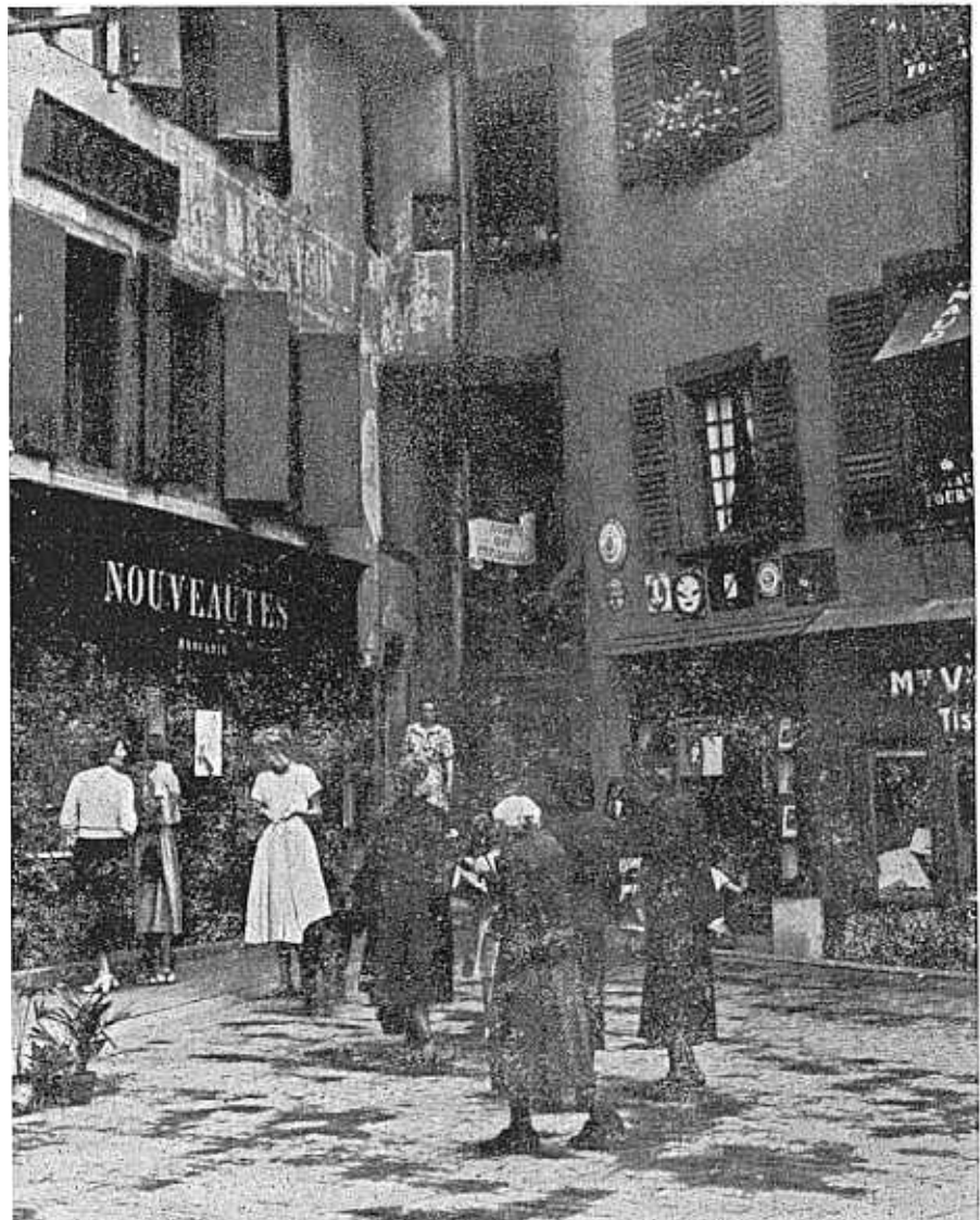
De eerste prijswinnaar in de afdeling Hoofdklasse. Een inzending van de heer Duyne afdeling Verkoop.

Werden we in de na-oorlogse jaren ieder najaar opgeschrikt door het instellen van speruren voor de elektrische stroom, met alle ongemakken van dien, dit keer is er een andere regeling ingesteld om het stroomverbruik in de piekuren zoveel mogelijk te beperken. Voor alle bedrijven wordt met ingang van 1 November de volgende regeling van kracht. Indien in de tijd tussen half vijf en half acht het verbruik van stroom stijgt boven het normale gebruik zullen de tarieven belangrijk verhoogd worden. En deze verhoging geldt dan niet alleen voor het meerverbruik maar voor het totaalverbruik aan stroom. Het is dus zaak het stroomverbruik zo gering mogelijk te houden. Er wordt dan ook verwacht, dat een ieder, vooral in de speruren, de grootste zuinigheid met kracht en licht zal betrachten.