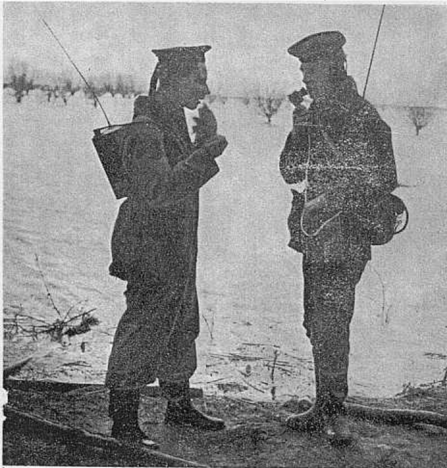
Zeeverkenkers geven met behulp van een Walkie-Talkie berichten door naar een hulpcentrum.

Bij alle rampspoed die de watersnood over ons land heeft gebracht, heeft het ons toch goed gedaan te bemerken welk een indrukwekkende rol de radio heeft gespeeld bij de hulpverlening. Weer is gebleken, dat de radio niet alleen maar een middel tot amusement is; in alle fasen van de ramp was de radio een prachtig communicatiemiddel, waarmee men veel onheil heeft weten te voorkomen.