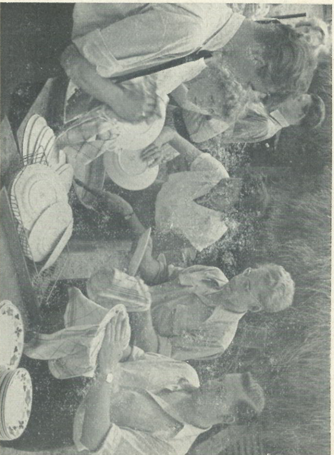
Met deze foto won de heer Meester, afd. Codering, de eerste prijs in de afdeling gevorderden. Niemand zal kunnen ontkennen dat de fotograaf met deze foto de „vacantie” bijzonder goed in beeld heeft gebracht.

Bij het uitschrijven van deze wedstrijd was de nadruk speciaal op het onderwerp „Vacantie” gelegd. Veel opnamen waren typische natuurfoto's, die in het geheel uitdrukking aan het begrip vacantie gaven. Het gevolg hiervan was, dat een aantal troostprijzen niet kon worden toegekend. Het toe-kennen van de eerste prijs was voor de jury