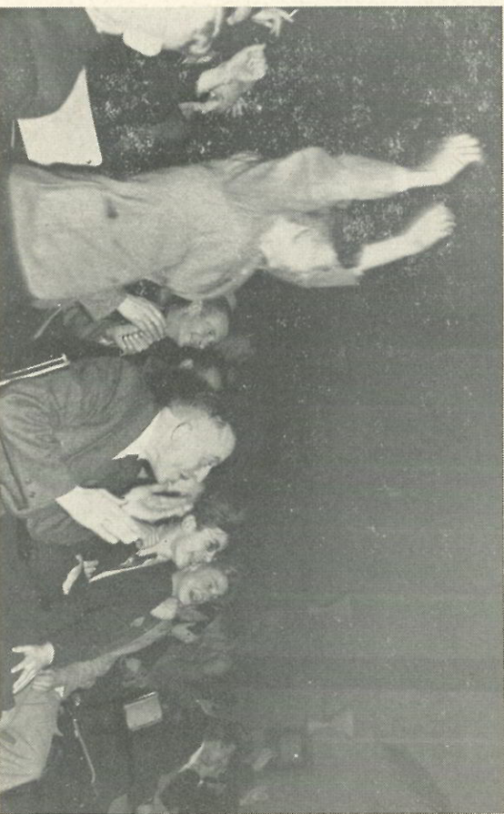
Dat men bij het zien van een voetbalwedstrijd op het televisiescherm even enthousiast kan meelevens als stond men werkelijk langs de lijnen, toont deze opname. Direct na het Belgische doelpunt scoort Abe Lenstra voor Nederland en dol van vreugde springt een toeschouwer op.

Als wij dan nog vertellen dat een telebericht goedkoper is dan een telefoongesprek en hoe meer teleberichten er worden opgegeven hoe sneller de verzending plaats vindt, dan twijfelen wij er niet aan, of het aantal telefoongesprekken zal verminderen en het aantal teleberichten overeenkomstig stijgen. Moet echter een bericht, waarbij geen haast is, aan Utrecht of het hoofdkantoor gestuurd worden, maak dan van de goedkoopste wijze van verkeer gebruik: de boodschappen-enveloppe.