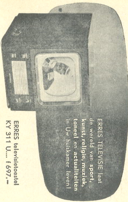
ERRES TELEVISIE laat de wereld van sport, kunst, religie, muziek, toneel en actualiteiten in Uw huiskamer leven!