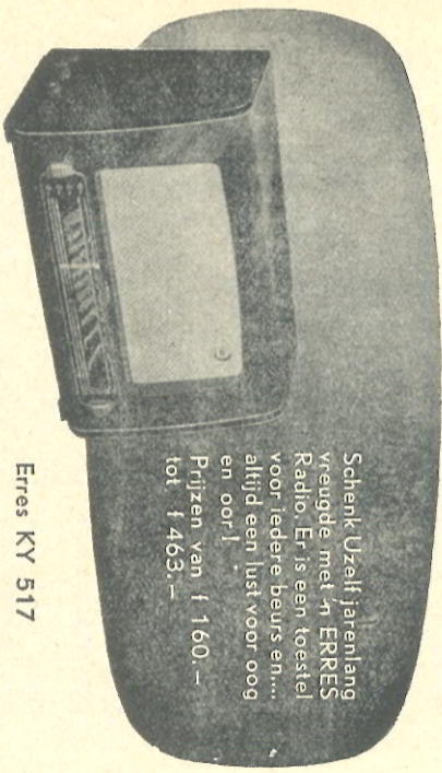
Erres KY 517