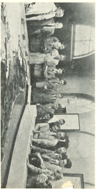
In de Cruquius werd de bepopulering van Nederland aan-schouwelijk voorgesteld. De bedrijfschool volgt aandachtig de explicaties van de gids.

De deelnemers aan het kwartaalsparen maken wij erop attent dat uitbetaling van de in het derde kwartaal 1952 gespaarde bedragen in beide pauzes in het ontspanningsgebouw zal plaatsvinden op Donderdag 2 October 1952.