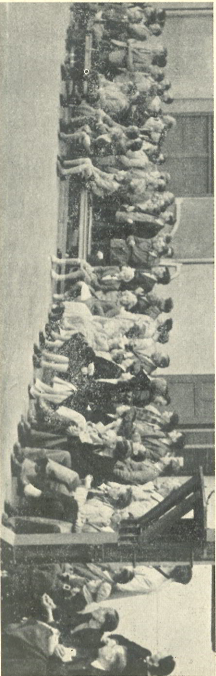
De klassemensproeven zijn in volle gang en gezien het gespannen kijken van de toeschouwers schijnen de hindernissen de volle aandacht te eisen.

De beide delen zullen f.57.50 kosten. Dat is voor zo'n prachtig werk wel niet veel, maar voor menige beurs een adertaling ineens. Nu kan men al dadelijk zich f.5,- besparen, door in te tekemen op dit werk vóór November a.s., als 't zal uitkomen. En ons persooneel kan nog een gemakkelijker betaling krijgen van f.5,- per maand of f.1,- per week, zonder prijsverhoging.