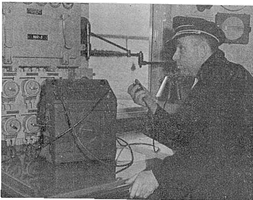
De stuurman van de Bellatrix aan de VDH zend/ontvanger.

Op 1 November ontving de postkamer de 20.000ste brief voor Afd. Inkoop. Vorig jaar was dit eind November.