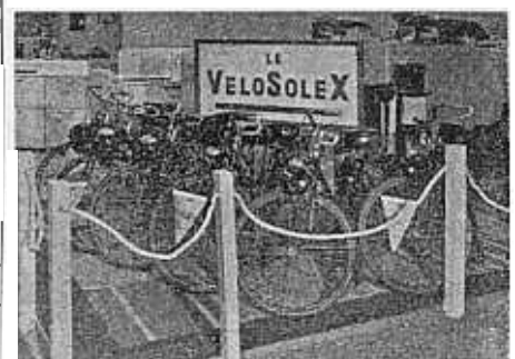
Onze Solexen op een Jaarbeurs in de Congo