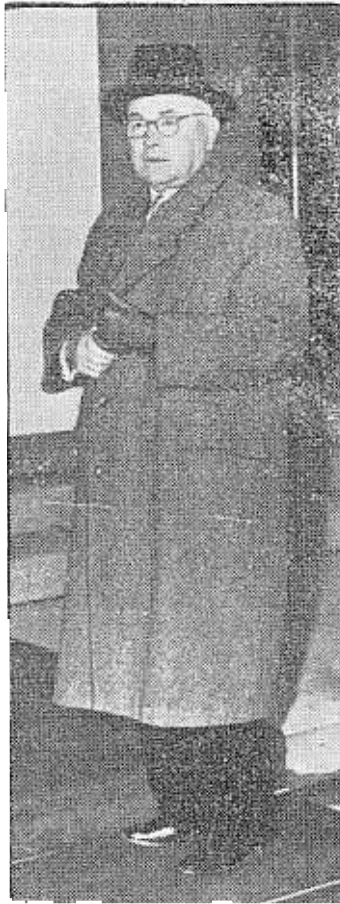
Dr L. G. Kortenhorst, voorzitter van de Tweede Kamer der Staten Generaal was bij het gezelschap Kamerleden dat Vrijdagmorgen onze fabriek bezocht.