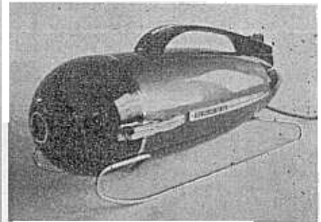
SZ 175 met voetschakelaar. Niet bedoeld als wasmachine.

Het vormingscentrum „DE VONK” te Noordwijkerhout organiseert op 8 en 9 September aanstaande een weekend voor jongeren. Jongens en meisjes boven 17 jaar. Men zal met elkaar zingen, volksdansen en luisteren naar muziek en wat er over verteld wordt. De kosten zijn f 3.— per persoon. Opgaven bij afdeling sociale zaken