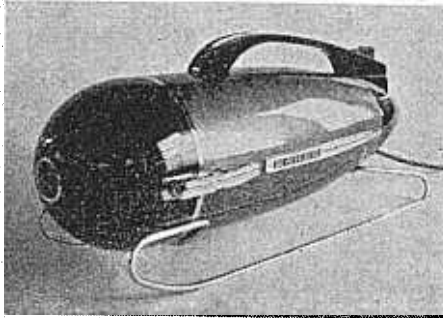
Erres SZ 175 een veilige stofzuiger

Het is bijvoorbeeld toch wel zeer droevig, dat de N.V. KEMA via de pers moet waarschuwen tegen een bepaald fabrikaat dompelaar, die maar rustig in de winkels te koop wordt aangeboden en die levensgevaarlijk is. Nederland is in dit opzicht bij andere landen