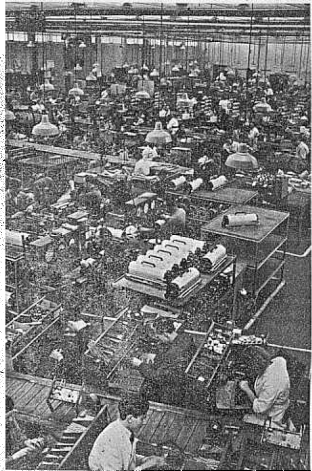
Montage afdeling fabriek Maanweg

De grootte van dit dividend is, afgezien van de bestaande overheidsbepalingen, in de eerste plaats afhankelijk van het feit of er winst gemaakt is.