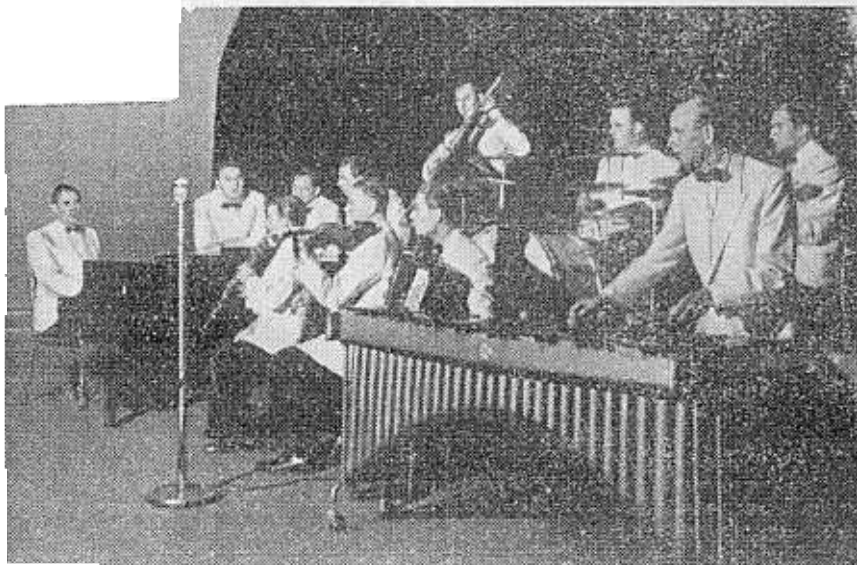
ORKEST ZONDER NAAM EN DRIE MUSKETIERS