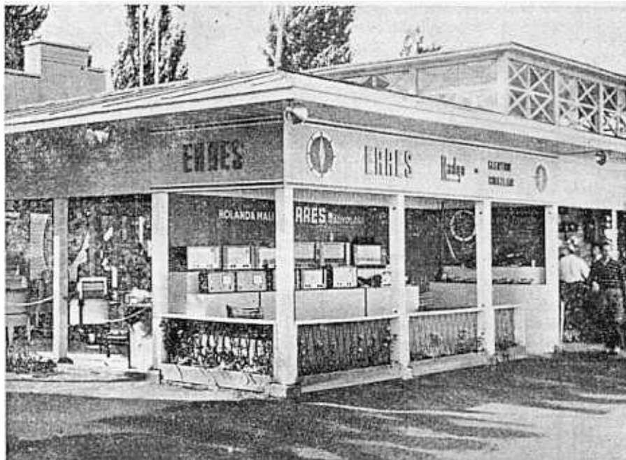
VDH IN HET BUITENLAND

Er zijn echter ook andere punten waar discretie geboden is. Wij maken de Solex. Wie op een VDH-Solex rijdt voelt zich „fabrikant” en dus min of meer verheven boven de gewone Solexisten die men op de weg tegenkomt. Is het wonder, dat men dit superioriteitsgevoel tracht te staven door de belang-