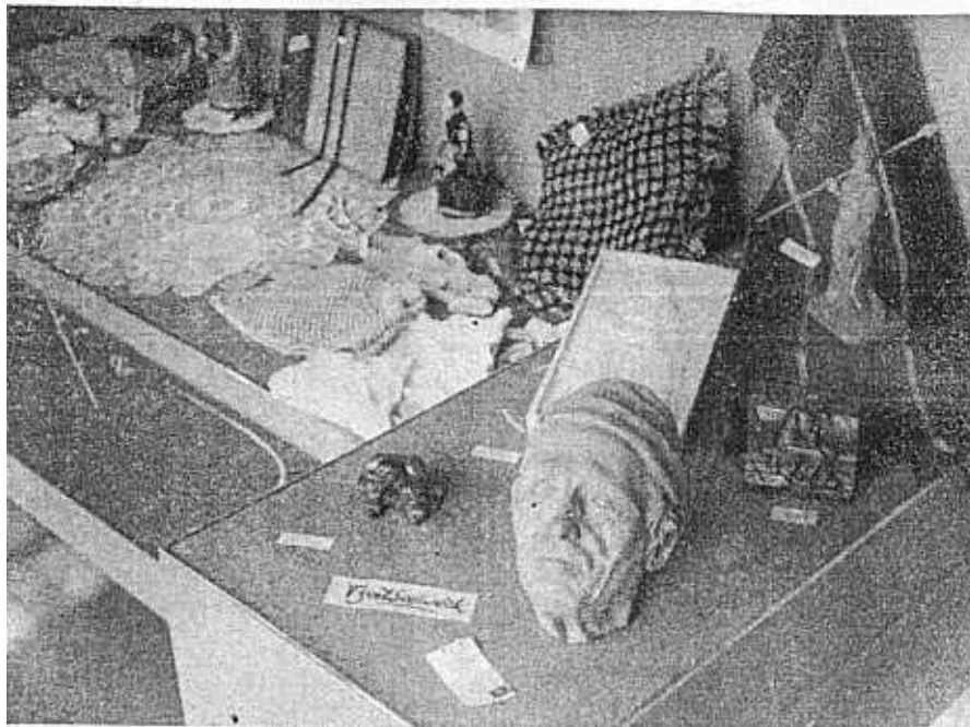
TENTOONSTELLING VRIJE TIJDSBESTEDING