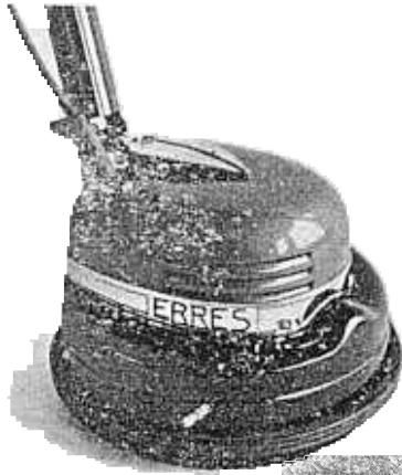
VLOERWRIJVER SZ 23. Ook hierin is rubber verwerkt.

Rubber, een artikel dat vooral de laatste 50 jaar stormenderhand de gehele wereld heeft veroverd, wordt in VDH-producten op vele plaatsen toegepast. Speciaal in onze elektrische huishoudelijke apparaten, waar het onder anderen toepassing vindt als stootband en ter verkrijging van de zogenaamde versterkte isolatie. Hieronder wordt verstaan het geheel geïsoleerd ophangen van de krachtbron, de electromotor, in het metalen frame.