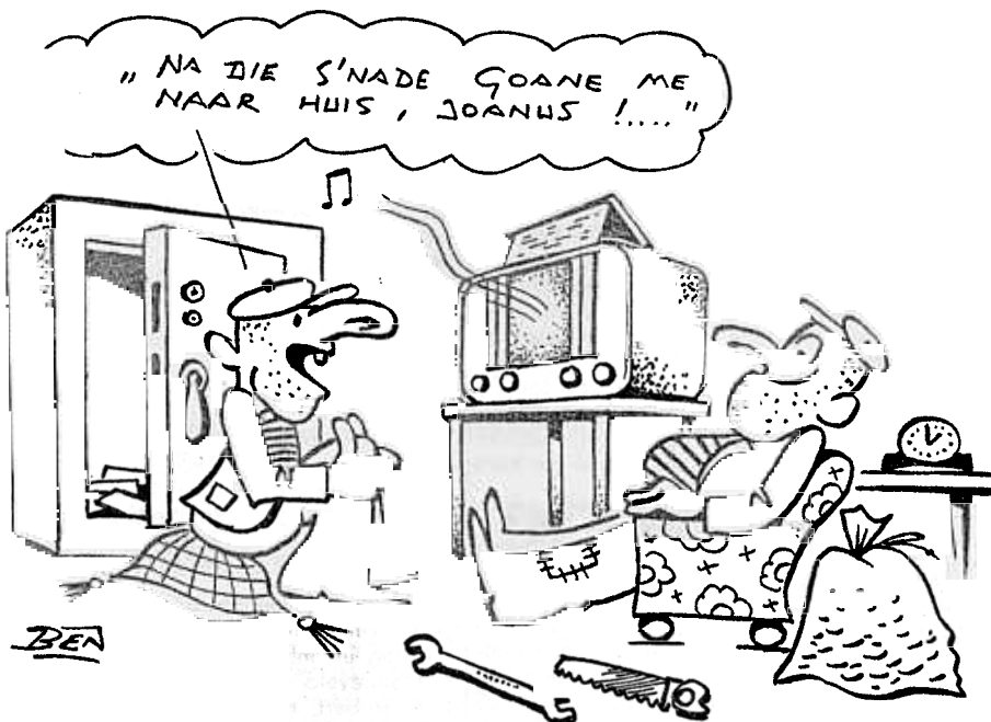
ELECTROLARIA VAN BEN