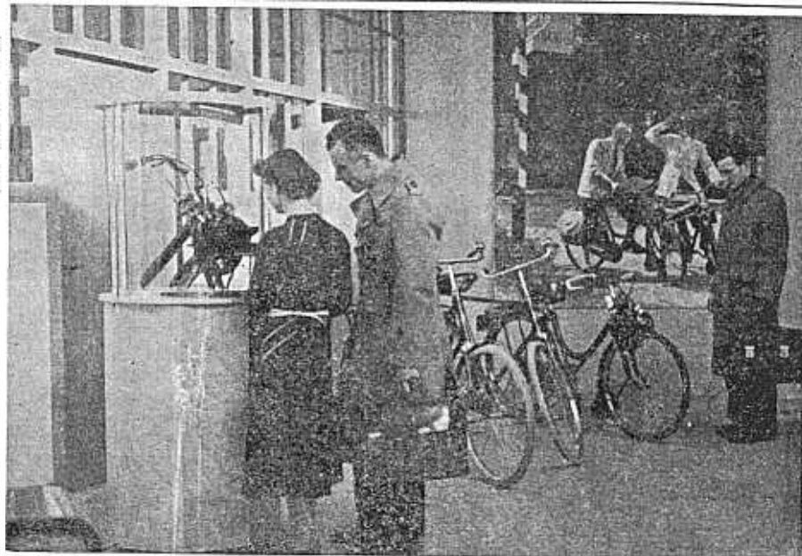
Toen de verbouwing van de laboratoria en sitie ingericht van alle door VHD vervaardigde producten. de toekomstige radio-tekenkamer een expo-

Voorbeeld: U verwondt op Maandag uw hand en moet onmiddellijk het werk staken. Een week later is uw hand genezen en zou u dus weer aan het werk kunnen gaan. Maar Woensdag tevoren, dus toen u twee dagen met uw hand in het verband liep, kreeg u griep. Als u op deze Woensdag vóór 10 uur 's morgens u ziek gemeld had bij afdeling Personeel, dan zouden de wachtdagen vallen op Woensdag, Donderdag en Vrijdag en de ziekgelduitkering op Maandag in kunnen gaan. Meldt u zich pas op deze Maandag ziek, dan vallen de wachtdagen op Maandag, Dinsdag en Woensdag. Voor de bovenwettelijke verzekeren ligt de zaak iets anders, omdat deze aanvankelijk één wachtdag maken; maar toch is het ook hier van belang zich onmiddellijk ziek te melden.